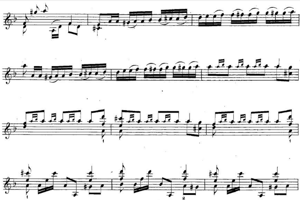
Ilustración 2. Fandango variado op. 16 (D. Aguado) (fragmento).

Este fragmento corresponde a un extracto de Le Fandango Varié (llamado Fandango Variado o Variaciones sobre el Fandango) op. 16, publicado por Aguado en París en torno a 1836. En este caso vemos la clara sonoridad del fandango, estilo ya empleado con anterioridad desde finales del siglo XVII (Castro, 2014), con la insistente alternancia entre I y V tonales en modo menor, con predominio de la V, resultando una sonoridad tendente a la alternancia I-IV flamencos. La tonalidad de Re menor coincide en armadura con el La flamenco o el toque “de patilla”. Destacar el intervalo melódico de 2 a aumentada, prohibido por la armonía tonal occidental del XVIII y tan característico de la música flamenca, que podemos ver del Si bemol al Do sostenido semicorcheas, en los compases segundo y cuarto de este extracto.