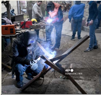
Residents of Lviv making Czech hedgehogs / Habitantes de Leópolis fabricando erizos checos antitanque